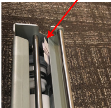
*画像 13 スリッター内部に細長い余白紙片