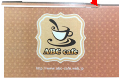
*画像 11 途中までしか切れていない