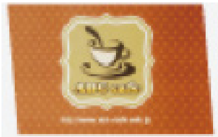
*画像 17 ひし形にカットされた状態