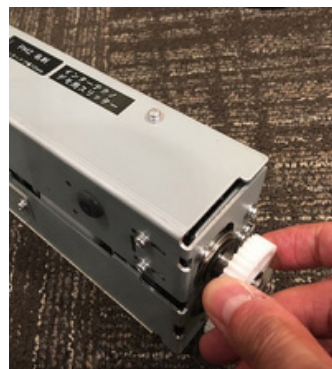
*画像 14 スリッターの白いギアを回して確認