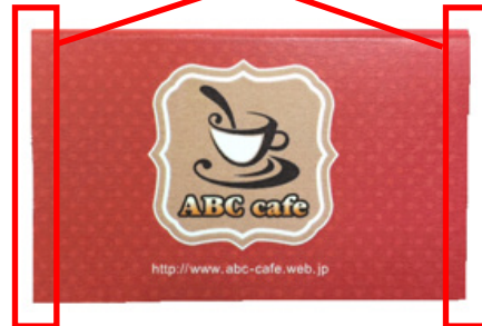
*画像 16 短辺