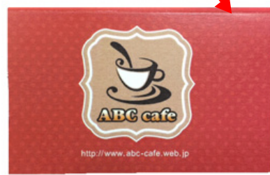
*画像 12 カット位置で折れた状態